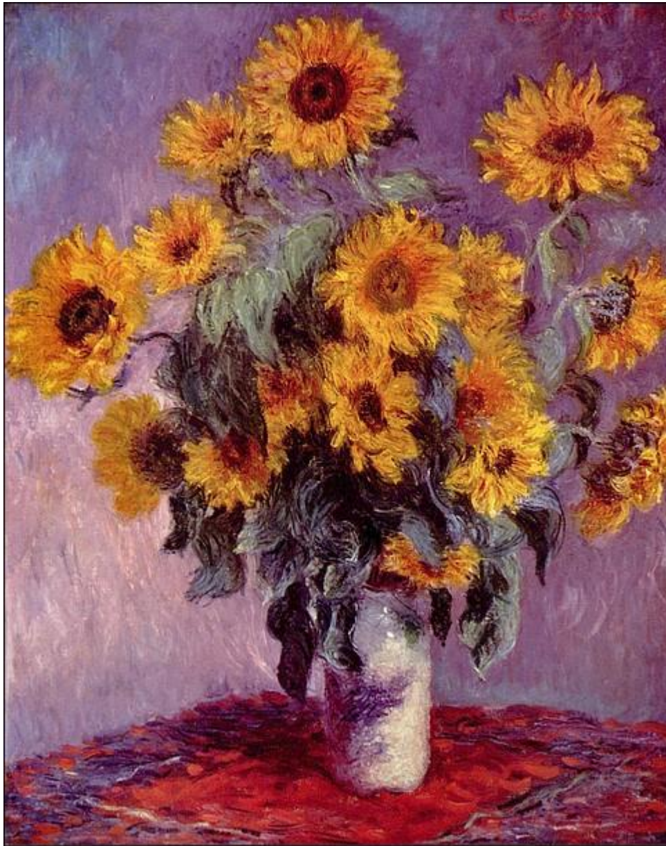
Claude Monet - Bukiet słoneczników; 1881; 81x101; olej/płótno