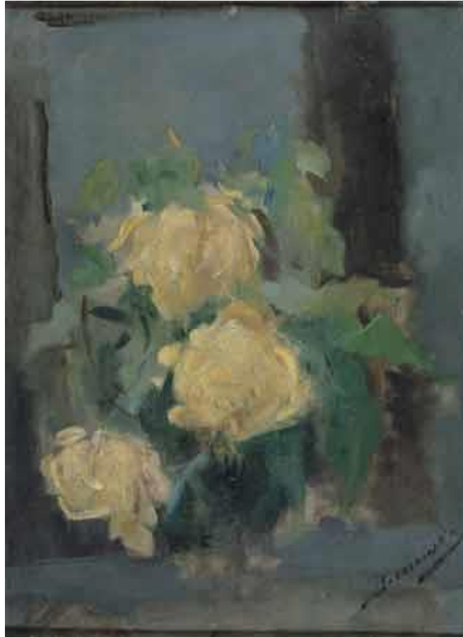
Olga Boznańska - Złote róże